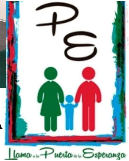
LUCHA CONTRA LA POBREZA INFANTIL