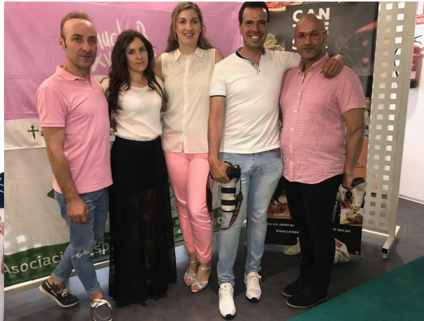
DESFILE MUJERES MASECTOMIZADAS A. ESPAÑOLA CONTRA EL CANCER (MONTIJO Y BADAJOZ)